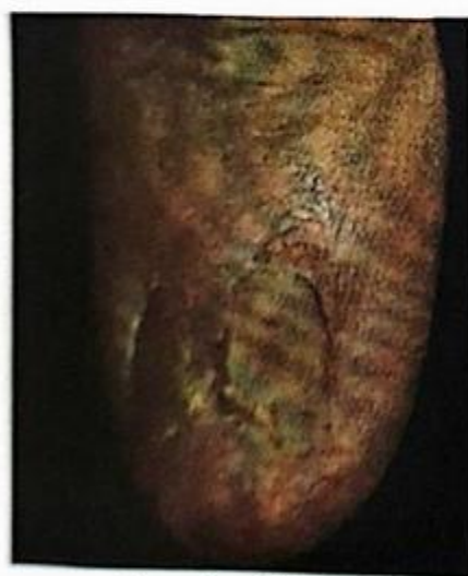
لیکن پلان در ناخن

انواع لیکن پلان می‌باشد وجود پاپول‌ها روی سطح فلکسور، مچ دست‌ها و ساعد، ناحیه کمری و مچ پاها در تشخیص بیماری کمک‌کننده است. ۴- در نوع هیپرتروفیک، ضایعات ضخیم و قرمز تیره شده و معمولاً